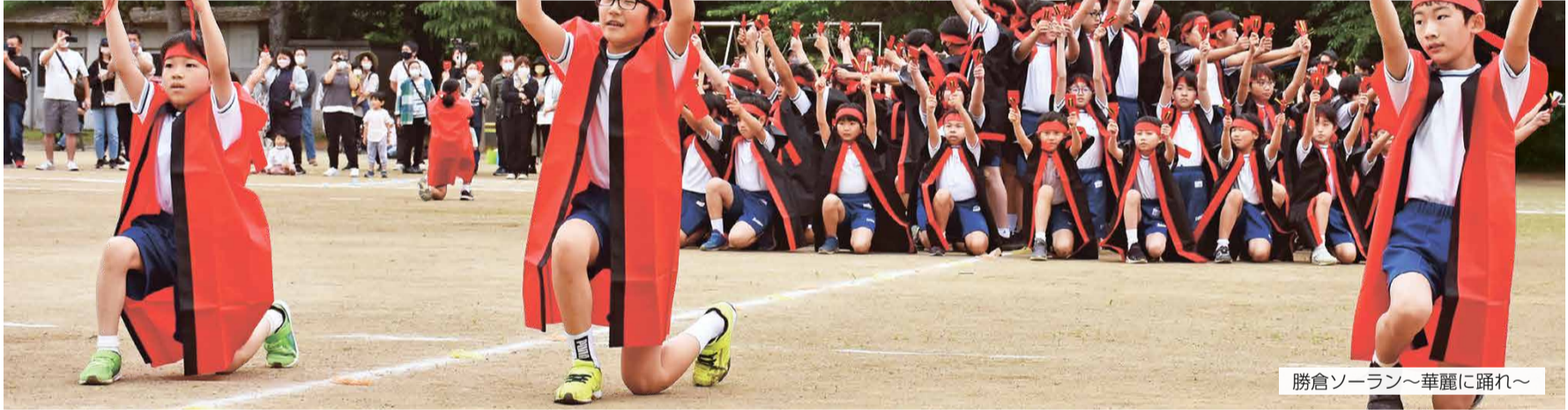
勝倉ソーラン〜華麗に踊れ〜